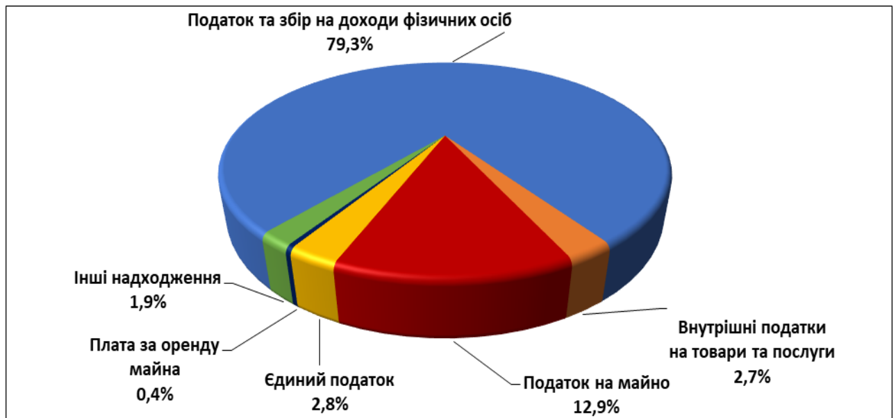
Мал.1. Питома вага податків і зборів у загальному обсязі надходжень загального фонду.

Виконання загального фонду склало 105,1% від плану звітного періоду та 80,1% від уточненого річного планового показника.